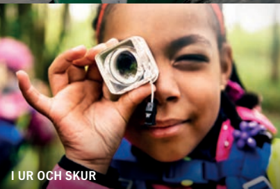
I UR OCH SKUR